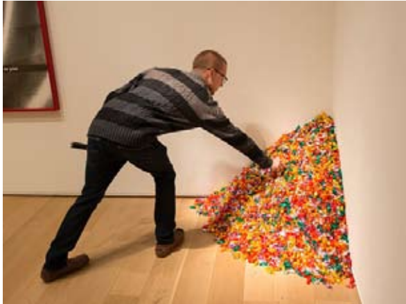
Felix Gonzalez-Torres, Sans titre ( Portrait de Ross à L.A.), 1991 Bonbons multicolores enveloppés individuellement, 79 kilos, dimensions variables