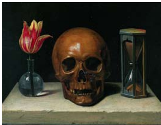
Philippe de Champaigne, Vanité, ou Allégorie de la vie humaine , 1642 Huile sur bois Musée de Tessé, Le Mans