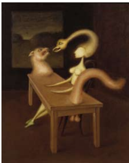
Victor Brauner, Fascination , 1939 Huile sur toile, 63,5 x 53,3 cm San Francisco Museum of Modern Art, San Francisco, CA, USA

Souvent présentées dans des vitrines, les sculptures hybrides de Thomas Grünfeld (né en 1956) évoquent la tradition des trophées de chasse et les cabinets d'amateurs du 18 e siècle. Avec ses Misfits , sorte de bestiaire inspiré de contes et légendes populaires bavarois, il procède comme un taxidermiste. A la fois familiers et étranges, les Misfits sont des assemblages d'animaux empaillés, défis à la création aussi improbables que l'ornithorynque, chimères semblant tout droit sorties d'un rêve provoquant inquiétude et fascination. L'œuvre de Thomas Grünfeld s'inscrit dans une démarche artistique commune à un certain nombre d'artistes des années 1990 pour lesquels l'animal reflète la nature profonde de l'homme. Qu'il soit emblème, parure, fétiche ou symbole, l'animal offre un vaste champ d'expérimentations. Ces différentes hybridations animales ne sont pas sans évoquer l'actualité scientifique, notamment les diverses manipulations et mutations génétiques.