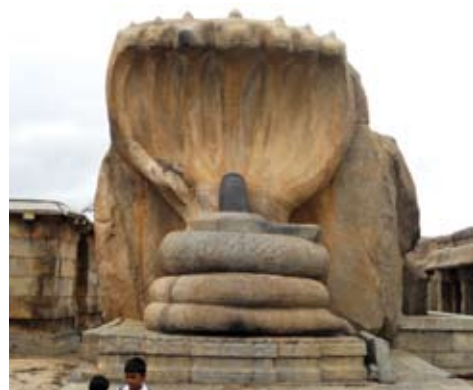
Shiva Lingam au serpent à sept têtes Temple Veerabhadra à Hanti, Inde, 16 e siècle

Cette figure illustre la fertilité tout en permettant de contrer les esprits malins et d'éloigner le mauvais œil. Ces phallus disproportionnés parfois pourvus d'ailes ou zoomorphes étaient visibles le long des rues de Pompéi, sur les mosaïques au sol, aux murs, à l'extérieur des boutiques, sculptés en bas-reliefs ou en ronde-bosse. La plupart d'entre eux sont aujourd'hui visibles hors de leur contexte, dans le « cabinet secret » du Musée archéologique national à Naples.