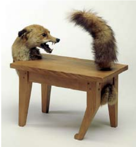
Victor Brauner, Loup-Table, 1939-1947 Bois et éléments de renard naturalisé