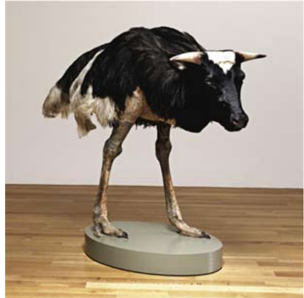
Thomas Grünfeld, Misfit (cow) , 1997 Taxidermie The Saatchi Collection

L'œuvre Loup-Table de l'artiste Victor Brauner (1903-1966), probablement réalisée à l'instigation d'André Breton, était visible dans l'exposition internationale Le Surréalisme en 1947 organisée en juillet 1947 à la galerie Maeght à Paris. Cette sculpture hybride, composée d'un loup empaillé et d'une table dont l'un des pieds semble prendre vie, s'inscrit dans la lignée des productions surréalistes de l'époque. L'univers des chimères et des loups-garous envahit les œuvres du peintre dans les années 1930 : comme un prélude à la version en trois dimensions, Loup-Table est au centre de la peinture Fascination réalisée en 1939. L'animal mort et empaillé, dont seules la tête, la queue et les bourses subsistent, incarnent les différentes facettes de l'énergie animale, entre menace et désir sexuel.