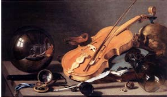
Pieter Claes, Nature morte à la boule de verre , 1634 Huile sur bois Nationalmuseum Nuremberg

Le volume transparent est l'une des métaphores fréquentes de la peinture de vanité. Elle peut prendre une forme de boule de verre, de bulles de savon ou de verre vide. Ces symboles montrent la fragilité et la futilité de la vie humaine. De nombreux poèmes du 17 e siècle comparent ainsi la vie de l'homme à du verre : « Devant la mort tu n'es rien : tu es du verre », nous dit le poète allemand Andreas Gryphius (1616-1664) dans un extrait de Oden und Epigramme . Le verre est un matériau ambivalent : signe de richesse et d'opulence matérielle, il se pare souvent d'une signification spirituelle. Parce que le verre est étroitement associé à la lumière, il peut également produire un reflet comme le fait un miroir, il élargit ou approfondit notre perception visuelle et semble rendre visible à nos yeux un monde opaque ou caché. Les nombreuses perles, le verre, les nacrés et les miroirs utilisés par Bruno Pélassy inscrivent ses œuvres dans cette esthétique des vanités.