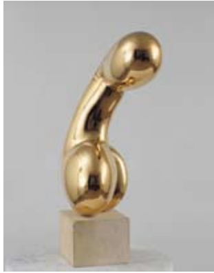
Constantin Brancusi, Princesse X, 1915-1916 Bronze poli, pierre (calcaire), 61,7 x 40,5 x 22,2 cm

Née en pleine ère Dada, Princesse X joue sur le double-sens et l'ambiguïté, bien que le sculpteur roumain Constantin Brancusi (1876-1957) ait toujours affirmé que « ses lignes sinueuses résument en un seul archétype toutes les effigies féminines de la terre ». Figure féminine épurée à l'extrême, et dont ne subsistent que les courbes d'un buste et d'un visage, les détails d'une main et la suggestion d'une chevelure, elle évoque aussi le corps viril et androgyne d'une femme devenue sexe masculin. Condensé de vanité et d'érotisme, ce bijou luisant frôle l'abstraction. Exposée au Salon des Indépendants de 1920, Princesse X fut considérée comme pornographique et retirée à l'ouverture de l'exposition, puis replacée suite à la protestation de nombreux artistes.