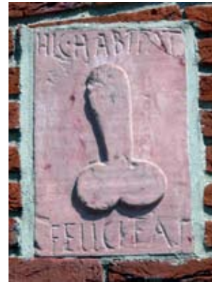
Hic habitat felicitas (Ici réside la bonne fortune) Plaque à l'entrée d'une maison à Pompéi, Italie, 1 er siècle après J.C.

En tuf (roche volcanique ou calcaire), fiché dans un mur d'enceinte, sculpté dans le marbre ou coulé dans le bronze avec quatre grelots pour éloigner les indésirables du seuil des boutiques et des maisons, le phallus en érection était très représenté à Pompéi. Loin de tout caractère érotique, ce symbole évoque la capacité à donner la vie et la force virile.