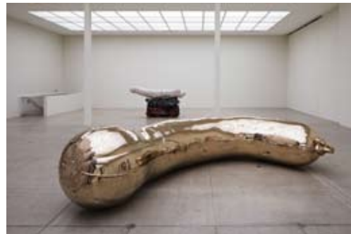
Sarah Lucas, NOB, 2013 Vue de l'installation à Secession, Vienne, Courtesy Sadie Coles HQ, London

Démesurément haut (deux mètres), doré et gonflable, Brancusi Tree (2007) de Paul McCarthy joue également sur cette ambiguïté sexuelle. Cette œuvre est aussi directement inspirée du travail de Constantin Brancusi, de Princesse X notamment, mais aussi du motif répétitif de la Colonne sans fin (1937) cher au sculpteur, qui sera exploré et décliné tout au long de son travail artistique. A mi-chemin entre l'objet décoratif, l'objet sexuel, le jouet, l'arbre, Brancusi Tree est avant tout une sculpture abstraite basée sur la citation, non dénuée d'humour, d'un sculpteur historique.