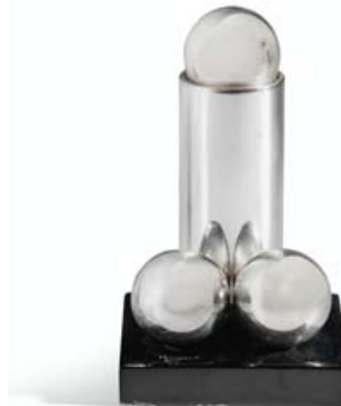
Man Ray, Presse-papier à Priape , 1920-1966 Argent, 12,5 cm Collection privée

Née en pleine ère Dada, Princesse X joue sur le double-sens et l'ambiguïté, bien que le sculpteur roumain Constantin Brancusi (1876-1957) ait toujours affirmé que « ses lignes sinueuses résument en un seul archétype toutes les effigies féminines de la terre ». Figure féminine épurée à l'extrême, et dont ne subsistent que les courbes d'un buste et d'un visage, les détails d'une main et la suggestion d'une chevelure, elle évoque aussi le corps viril et androgyne d'une femme devenue sexe masculin. Condensé de vanité et d'érotisme, ce bijou luisant frôle l'abstraction. Exposée au Salon des Indépendants de 1920, Princesse X fut considérée comme pornographique et retirée à l'ouverture de l'exposition, puis replacée suite à la protestation de nombreux artistes.