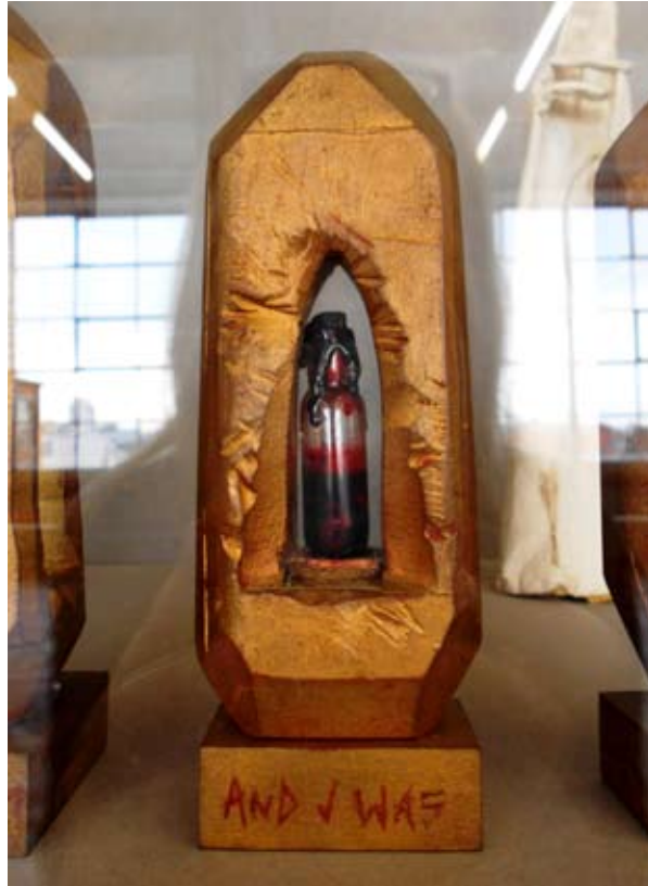
Bruno Pélassy, Sans titre (détail) Petits reliquaires : Bois doré, fioles de sang, verre, peinture Collection Famille Pélassy