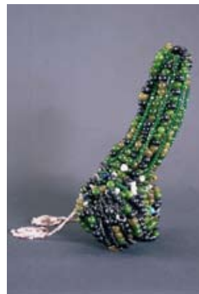
Bruno Pélassy, Sans titre ( Bye Bye Jeff ), 1998 Pâte de verre, cristal, cornaline, perles de verre, fil et tiges métalliques, fil de coton, plastique 22 x 24 x 37 cm Collection Paulette et Roger Pélassy

Entre la fin du 18 e siècle et la fin du 19 e siècle, les artistes utilisent différentes stratégies pour dissimuler le sexe masculin. Sur le corps des héros nus, un ruban, un drapé ou une épée seront intentionnellement placés devant les organes génitaux. Le 20 e siècle est marqué par la domination masculine et une certaine libération des mœurs. Sans parler de réelle exhibition, certains artistes se sont attachés à reproduire les verges en érection, qu'il s'agisse d'Egon Schiele dans ses Nus autoportraits (1914-1915) ou de Jean Cocteau à travers ses dessins érotiques pour l'ouvrage Querelles de Brest (1947) de Jean Genet. Des artistes contemporains ont également attribué une place de choix au pénis dans leur œuvre : Gilbert & George, Sarah Lucas, Paul McCarthy ou Robert Mapplethorpe.