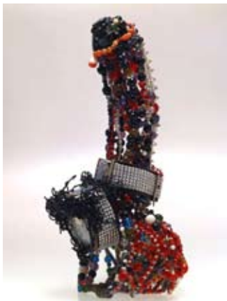
Bruno Pélassy, Amour , 1998 Perles, cristal, corail, métal, fil métallique 48 x 20 x 23 cm Collection Rose et Pat Michaud

Motif récurrent dans l'œuvre de Bruno Pélassy, le sexe masculin en érection est à la fois un symbole de sexualité, de fécondité, de vie. Paré de cristaux ou de métal, il devient sculptural et prend des allures de bijou ou de relique. Dans l'exposition au Crédac, le phallus est présent à plusieurs reprises, dans une version surdimensionnée en pierres fines et perles de verre, et, plus réaliste et explicite, sous la forme d'un godemichet. Le phallus a longtemps été un symbole de fertilité et de prospérité en Occident, notamment en Grèce ou dans l'Empire romain, où il était fréquemment représenté.