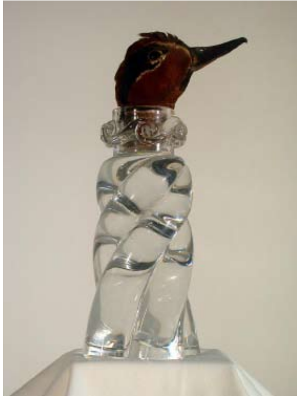
Bruno Pélassy, Sans titre, 2000 Tête de sarcelle naturalisée, cristal de Baccarat Collection Château du Rivau