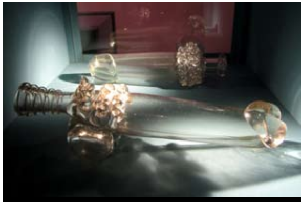
Bouteille-Phallus Verre soufflé, 17 e siècle Musée de Cluny – Musée national du Moyen Âge, Paris

En Europe, la christianisation a rejeté les symboles génitaux dans la sphère du péché. Ainsi, en le représentant uniquement dans un cadre privé, les symboles phalliques se sont vus progressivement classés comme obscènes et païens.