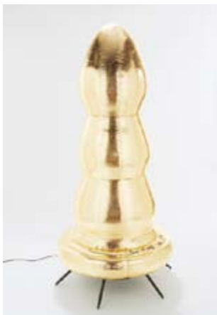
Paul McCarthy, Brancusi Tree , 2007 Sculpture auto-gonflable en film Mylar doré et ventilateur intégré, 203,2 x 101,6 x 101,6 cm Collection privée

L'américain Man Ray (1890-1976), à la fois peintre, photographe, cinéaste et acteur du mouvement Dada, réalise cette sculpture aux connotations sexuelles évidentes. Pourtant il s'agit avant tout d'un objet utilitaire (un presse-papier) dont les éléments peuvent se détacher pour faire tenir plusieurs piles de feuilles. Cet objet phallique est dédié à Priape, le dieu grec de la virilité et de la fertilité, que l'on reconnaît par son gigantesque pénis constamment en érection.