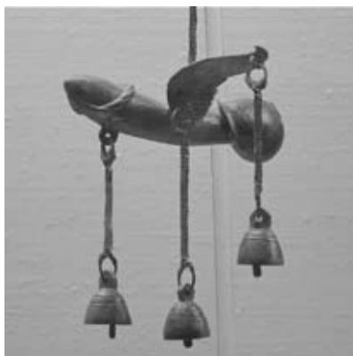
Phallus ailé en bronze à grelots Pompéi, 1 er siècle après J.C. Musée archéologique national, Naples

Motif récurrent dans l'œuvre de Bruno Pélassy, le sexe masculin en érection est à la fois un symbole de sexualité, de fécondité, de vie. Paré de cristaux ou de métal, il devient sculptural et prend des allures de bijou ou de relique. Dans l'exposition au Crédac, le phallus est présent à plusieurs reprises, dans une version surdimensionnée en pierres fines et perles de verre, et, plus réaliste et explicite, sous la forme d'un godemichet. Le phallus a longtemps été un symbole de fertilité et de prospérité en Occident, notamment en Grèce ou dans l'Empire romain, où il était fréquemment représenté.