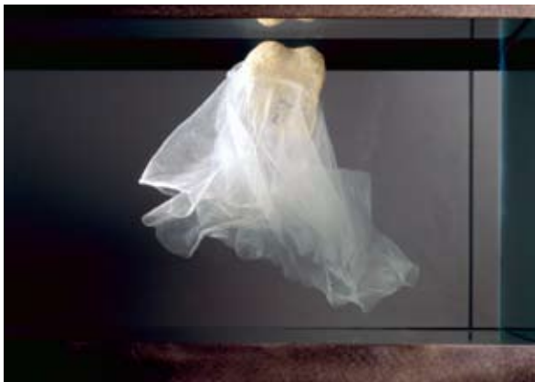
Bruno Pélassy, Relaxing Balls , 2000 Série des Créatures Dentelle d'Argentan, dentelle à l'aiguille, fil de coton, tulle de soie, gel silicone, perles de cristal, aquarium en verre et acier Centre national des arts plastiques, Paris

Nourri d'une formation artistique et scientifique, le travail d'Hicham Berrada (né en 1986) associe intuition et connaissance, science et poésie. Du laboratoire à l'atelier, de l'expérience chimique à la performance, l'artiste explore dans ses œuvres des protocoles scientifiques qui imitent au plus près différents processus naturels et conditions climatiques. Présage est le fruit d'une performance dans laquelle l'artiste fait émerger un monde chimérique en associant des produits chimiques dans un bocal. Ces transformations de la matière, mises en mouvement par ses manipulations, sont simultanément filmées et projetées à l'écran. Ces expérimentations donnent naissance à des modèles réduits d'organismes vivants qui sont ensuite figés dans la résine, devenant ainsi de véritables natures mortes. Arche (2013) est une vaste citerne qui contient tous les éléments nécessaires à la vie : des micro-organismes, une source de lumière et de chaleur et de l'eau en mouvement. Par l'ajout d'un élément perturbateur (le plastique), Hicham Berrada modifie l'équilibre de ce microcosme aquatique. Bruno Pélassy choisit également de faire évoluer ses Créatures dans des aquariums. A la fois méduses, fantômes, vêtements, elles peuvent rappeler les conditions primaires de notre existence et de notre évolution.